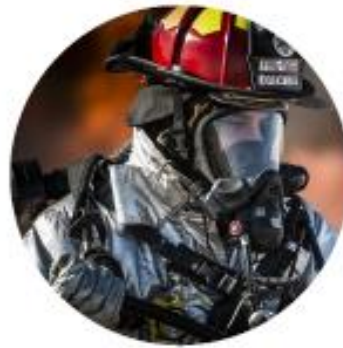
Les alvéoles Groupes privés / Stages