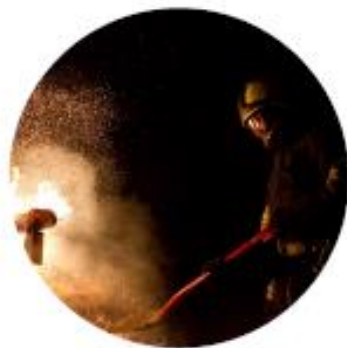
La prairie Espaces de ressources