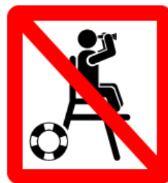
BAIGNADE NON SURVEILLÉE