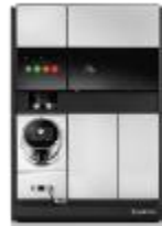
MOMENTO MINI TOWER