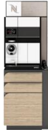
MOMENTO FULL TOWER