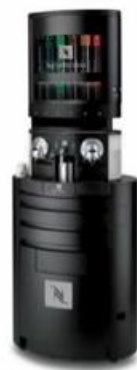
Gemini FULL TOWER