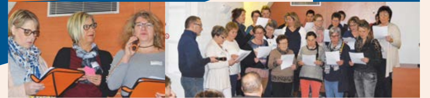
Moments d'échanges et de partage afin de faire le bilan de la journée précédente.