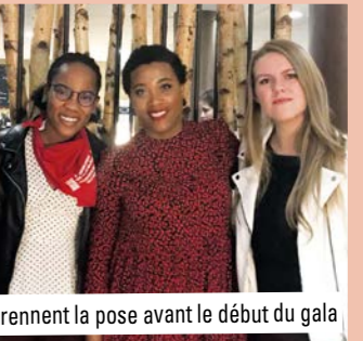
Les pupilles prennent la pose avant le début du gala