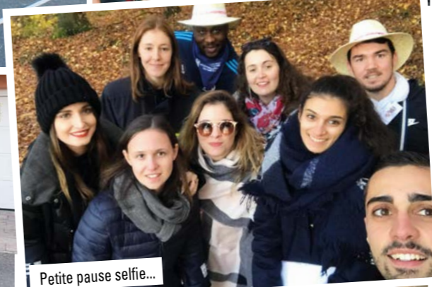
Petite pause selfie...