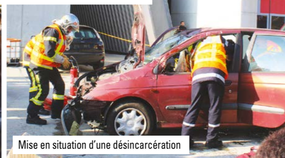
Mise en situation d'une désincarcération