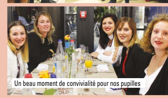
Un beau moment de convivialité pour nos pupilles