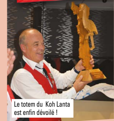
Le totem du Koh Lanta est enfin dévoilé !