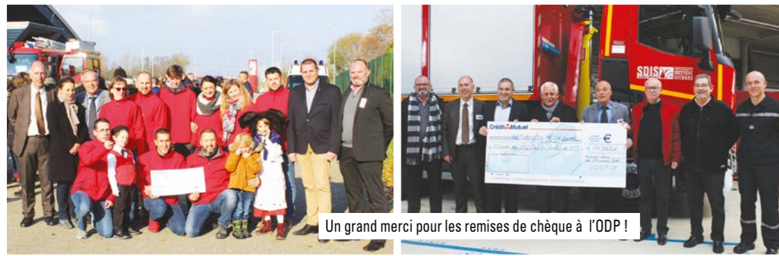
Un grand merci pour les remises de chèque à l'ODP !