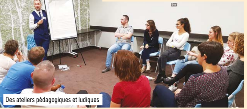
Des ateliers pédagogiques et ludiques