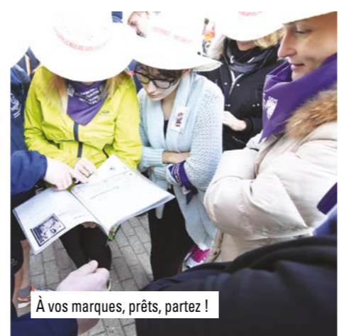
À vos marques, prêts, partez !