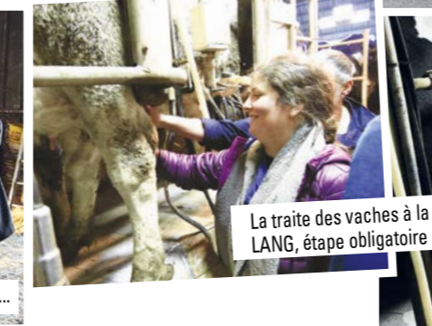
La traite des vaches à la ferme LANG, étape obligatoire !