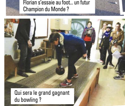
Qui sera le grand gagnant du bowling ?