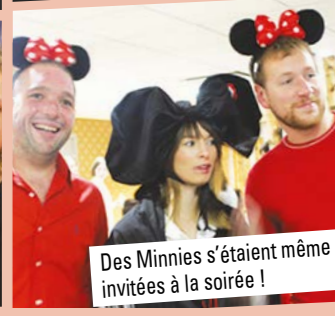
Des Minnies s'étaient même invitées à la soirée !