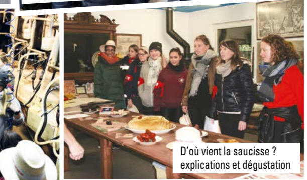
D'où vient la saucisse ? explications et dégustation