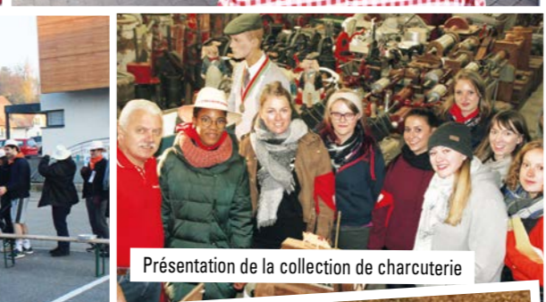
Présentation de la collection de charcuterie