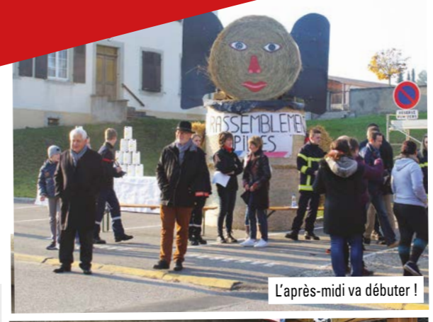
L'après-midi va débiter !