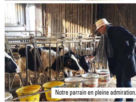
Notre parrain en pleine admiration...