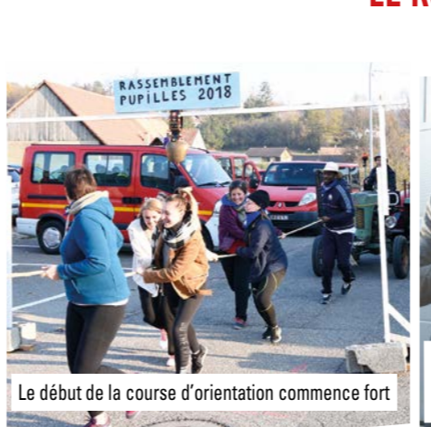
Le début de la course d'orientation commence fort