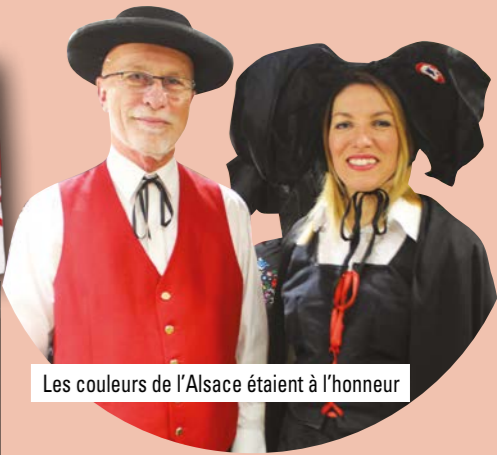
Les couleurs de l'Alsace étaient à l'honneur