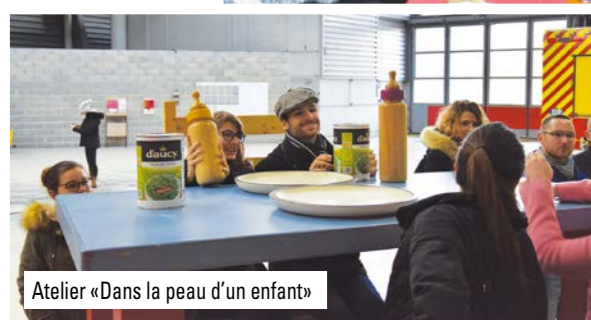
Atelier « Dans la peau d'un enfant »