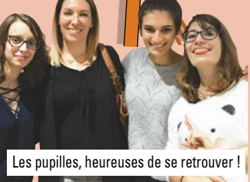
Les pupilles, heureuses de se retrouver !