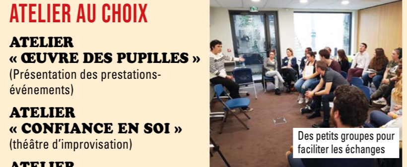
Des petits groupes pour faciliter les échanges

ATELIER « NOTARIAL » (accès à la propriété, création d'entreprise et droit familial)