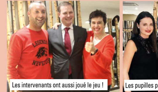
Les intervenants ont aussi joué le jeu !