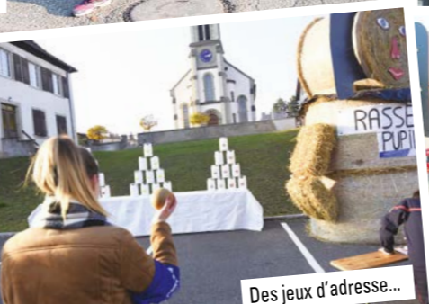
Des jeux d'adresse...