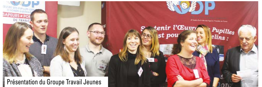
Présentation du Groupe Travail Jeunes