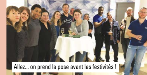
Allez... on prend la pose avant les festivités !