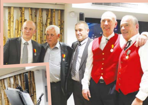
De belles distinctions ont été remises au cours de la soirée