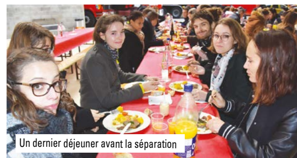
Un dernier déjeuner avant la séparation