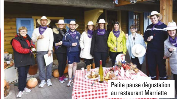
Petite pause dégustation au restaurant Marriette