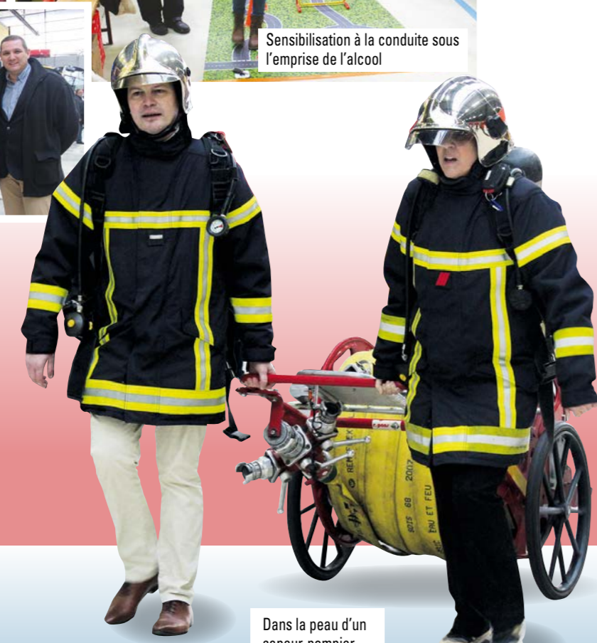
Dans la peau d'un sapeur-pompier