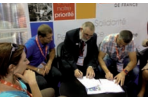
Souscription de l'UDSP 69 au Contrat national associatif Asso 18.

La vie associative et les activités avec les amicales ou les Unions sont importantes pour les sapeurs-pompiers et leur famille. Pour autant, ces moments de détente et de convivialité ne sont pas exempts de risques d'accidents corporels ou matériels. Il est donc primordial qu'elles veillent à se protéger, et à protéger leurs adhérents des risques éventuels. Pour cela, la MNSPF propose, sous l'égide de la FNSPF, une protection complète et au meilleur coût : le Contrat associatif national, Asso 18, destiné aux Unions régionales et départementales, aux amicales et associations de sapeurs-pompiers. Grâce aux options proposées, la MNSPF couvre les adhérents et les dirigeants dans les activités associatives exercées au sein des amicales et des UD, mais également en service commandé (en complément des garanties statutaires) et hors service commandé. Les Unions 33, 69 et 27 ont choisi d'adhérer au 1 er janvier 2015 : leur adhésion a été formalisée par une signature au congrès. Les départements 43 et 03 ont, quant à eux, sélectionné le capital décès toutes causes pour leurs adhérents.