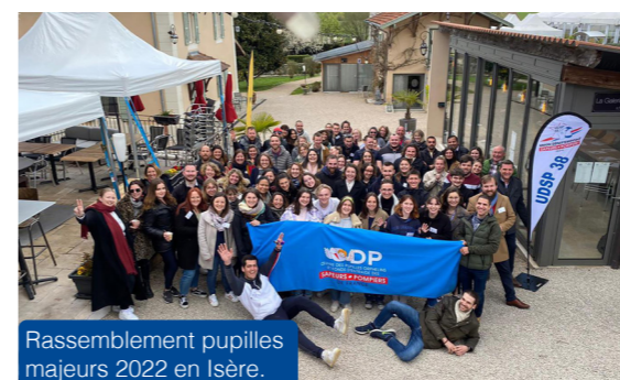
Rassemblement pupilles majeurs 2022 en Isère.

Du 21 au 23 avril 2023, la ville de Besançon accueillera près de 110 pupilles pour la 10 e édition du Rassemblement pupilles majeurs.