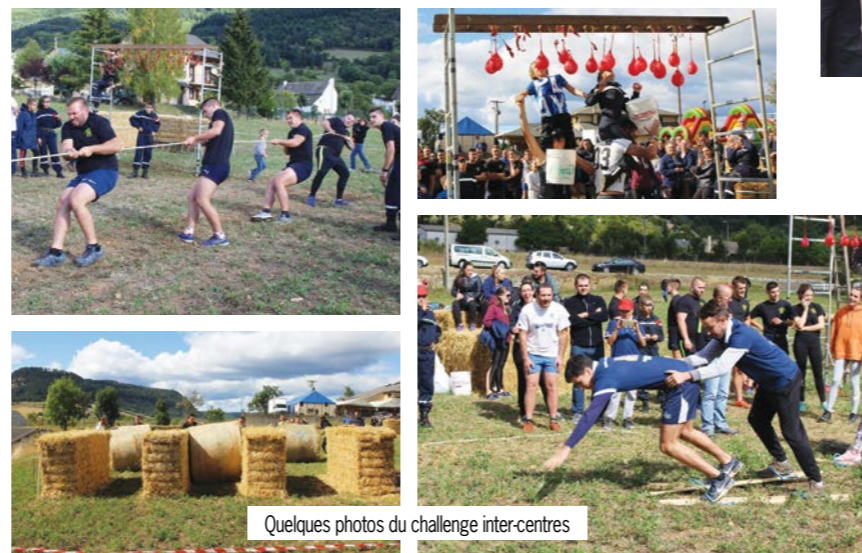
Quelques photos du challenge inter-centres

Le challenge inter centres, lors duquel 10 équipes se sont affrontées sous un beau soleil. Suivi d'un magnifique feu d'artifice puis d'une soirée repas dansant à la salle des fêtes. Bravo à tous pour votre investissement. Cette journée a permis de collecter 41 000€. Suivons le cheminement de la solidarité.