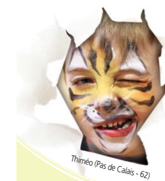
Thiméo (Pas de Calais - 62)

Yves Daniel, Premier Vice-Président avait tenu à faire le déplacement pour saluer et remercier les représentants de l'UDSP du Var et de l'UIISC n°7 de Brignoles, instigateurs de Concerts donnés par la Musique des Sapeurs-Pompiers de Paris au profit de l'Œuvre des Pupilles (26 et 27 novembre à Fréjus et St Maximin la-sainte-Baume). C'est à l'issue des cérémonies de Sainte Barbe qu'Yves Daniel s'est vu remettre un chèque d'un montant de 8 000 euros (4000 euros de l'UDSP du Var et 4000 euros de l'UIISC n°7) et 1 000 euros supplémentaires de Six Fours les Plages.