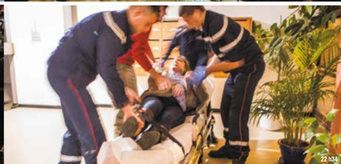
22 h 34

la mise en place du dispositif estival. La DZ ( dropping zone ) dans la cour de la caserne favorise la possibilité de projeter des équipes spécialisées hélicoptérées comme les plongeurs ou le Grimp basé au CSP. En journée, un des deux VSAV est prépositionné à l'ancienne caserne du « Moulin à vent », dénommé dorénavant « P Centre », car la route à deux voies pénétrantes en centre-ville sature rapidement et augmente les délais de près de cinq minutes.