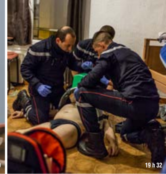
19 h 32