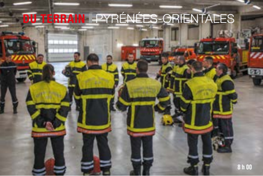
8 h 00