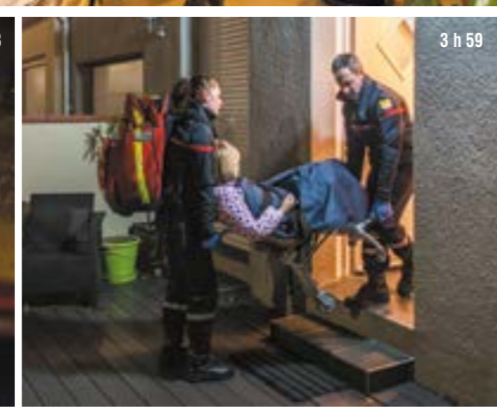
3 h 59