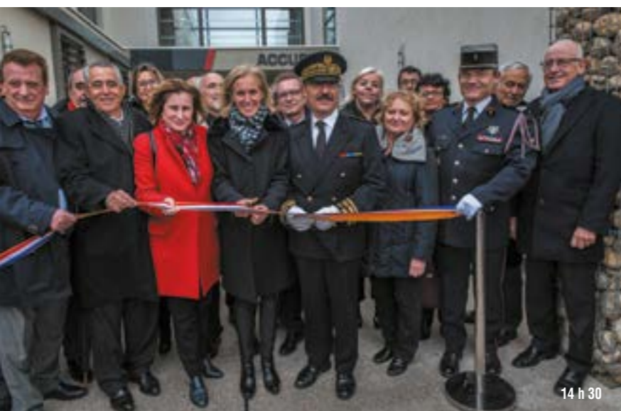
14 h 30