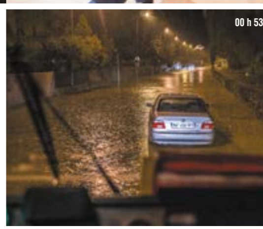
00 h 53

L'organisation se fait en trois équipes avec un régime de gardes postées 24 heures /48 heures. Les principaux risques sont d'ordre autoroutier, notamment à cause de l'axe France - Espagne saisonnier avec un afflux d'une population estivale, et enfin liés aux feux de forêt, d'où les renforts de sapeurs-pompiers saisonniers. En 2016, les sapeurs-pompiers du CSP, « pas encore tout à fait Perpignan Sud », ont réalisé près de 6 000 interventions. ■